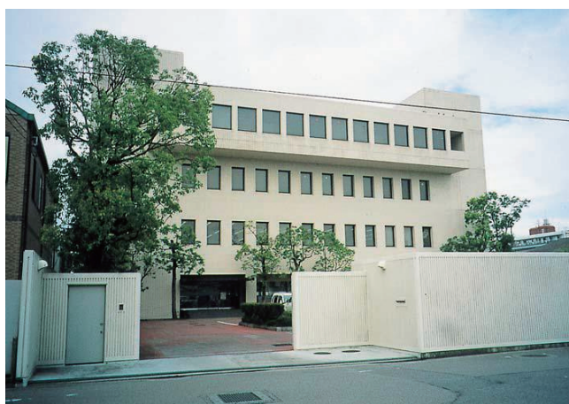
【株JAえひめ総合情報センター】